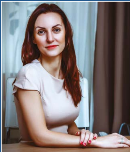
На зв'язку з відділеннями